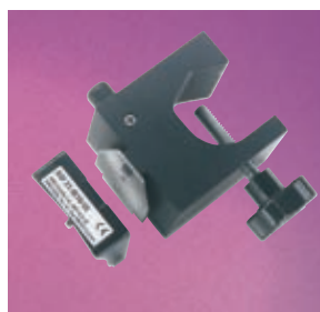
Morsetto per asta flebo