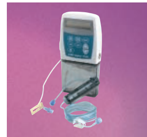
Cassetta e set per grossi volumi

CADD-Legacy, è un marchio registrato del Gruppo Smiths plc. Riferimento No. IN/0010/I - 03/06