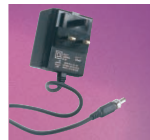
Trasformatore per CA