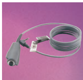
Pulsante dose per PCA